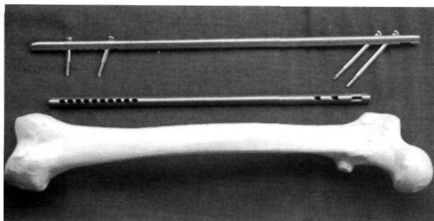
Figura 1. Clavo FRMP

El paciente se coloca en decúbito lateral en la mesa quirúrgica ordinaria. Se realiza una incisión proximal longitudinal lateral de 10-12 cm centrada en el ápice del trocánter mayor. En el punto medio de la zona de transición trocánter-cuello se efectúa una perforación con el punzón hasta labrar un canal intramedular en la porción proximal del fémur que se fresa manualmente hasta obtener un diámetro de 12 mm. A continuación se pasa una guía-fijador al fragmento distal, a la vez que se realizan maniobras para la reducción de la fractura mediante tracción y contracción.