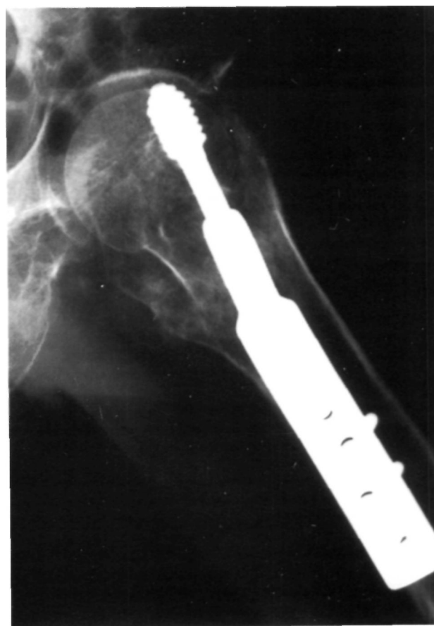
Figura 1. Protrusión del tornillo en la articulación coxofemoral.

Con ambas técnicas se consiguió sentar a los pacientes en el postoperatorio inmediato; en cambio, la capacidad de recuperar la marcha fue significativamente superior en el grupo de pacientes intervenidos con DHS (1,11). Se sufrió una alta tasa de complicaciones en los enfermos tratados con clavos de Ender, a destacar un 20% de reintervenciones por migraciones, más frecuentemente distales, lo que coincide con otros autores (18); también se constató una gran frecuencia de parálisis del CPE, que parece debida a la actitud en rotación externa mantenida en el pre y postoperatorio; esta complicación fue transitoria y es importante insistir en los cuidados de enfermería para evitarla.