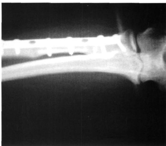
Figura 4. Radiografía a los 4 meses con consolidación del injerto óseo

El dolor cedió tras la intervención, confirmando el estudio anatómico-patológico el diagnóstico de sospecha. Se instauró tratamiento rehabilitador evolucionando satisfactoriamente, y consolidando el injerto a los cuatro meses de la intervención (Fig. 4).