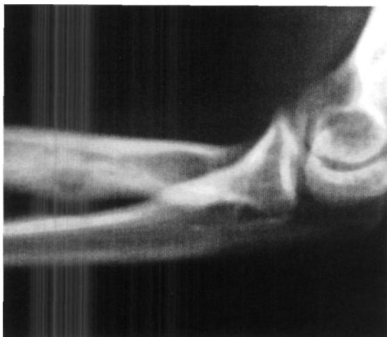
Figura 1. Radiografía simple. Imagen osteolítica con reacción periostica