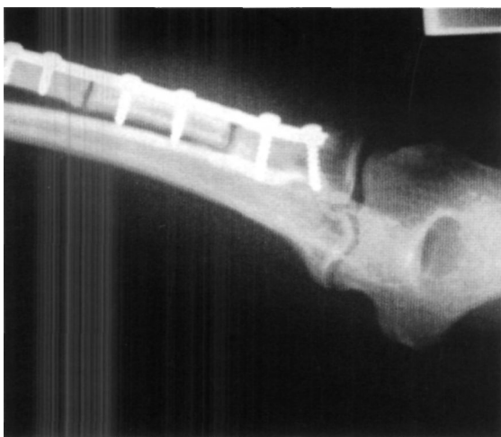
Figura 3. Radiografía postoperatorio inmediato