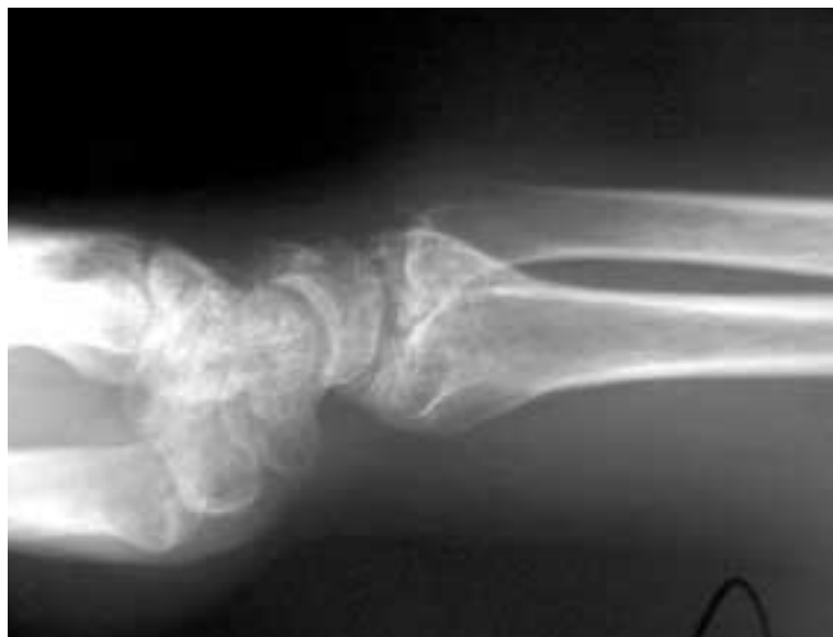
Figura 1. Subluxación radiocubital distal.