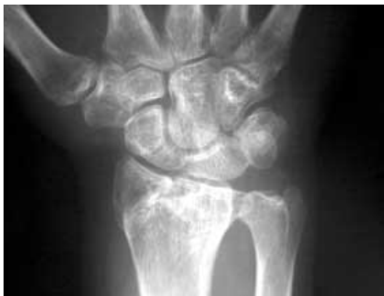
Figura 2. Incongruencia radiocarpiana.