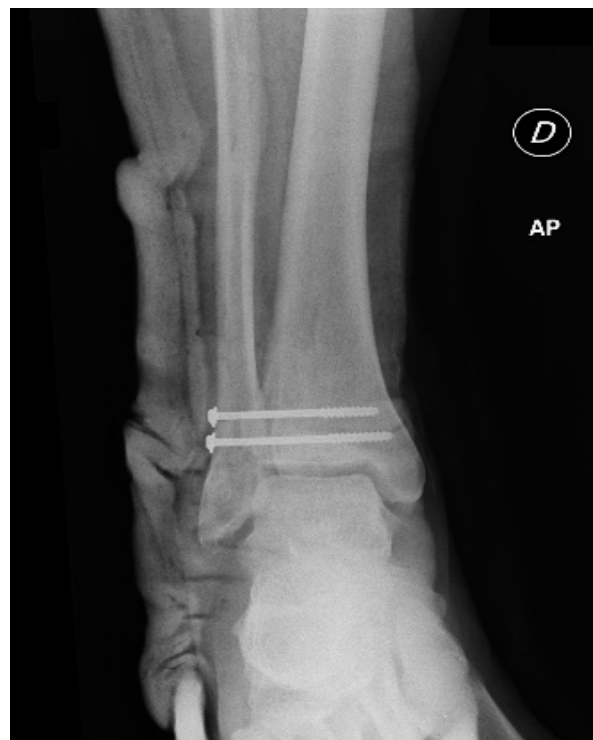
Figura 2. Reducción abierta y fijación interna con dos tornillos canulados de 4 mm.

Tras un seguimiento de 12 meses el paciente presenta una puntuación media de 86,8 en la escala AOFAS.