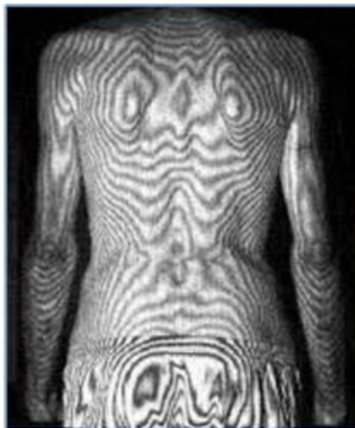
Figura 1. Topografía de Moiré.