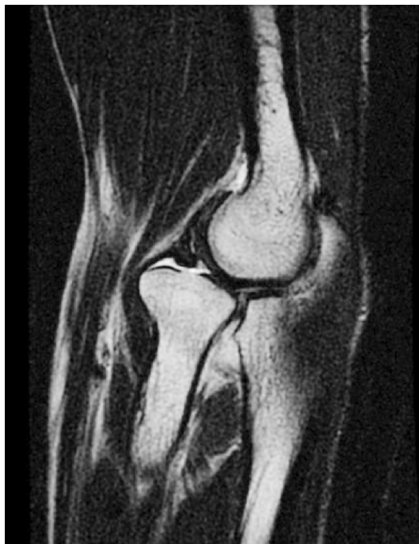
Figura 3. Imagen de RNM (Spin Eco potenciada en T2) del codo en corte sagital donde se aprecia la luxación anterior y pérdida de concavidad de la cabeza de radio.

do lesiones o antecedentes traumáticos en la infancia. Ante la sospecha y posibilidad de que existiera una fractura oculta no diagnosticada en la radiografía se solicitó una tomografía axial computarizada (TAC) (Fig. 2) donde se pudo confirmar el diagnóstico de luxación aislada de la cabeza de radio y ausencia de trazos de fractura. En Urgencias se intentó la reducción cerrada bajo control radioscópico sin éxito, por lo que, para determinar si se trataba de una lesión reciente o crónica se solicitó estudio mediante resonancia magnética (RM), observándose una escasa afectación de partes blandas en el codo y pérdida de concavidad de la cabeza del radio (Fig. 3 y 4).