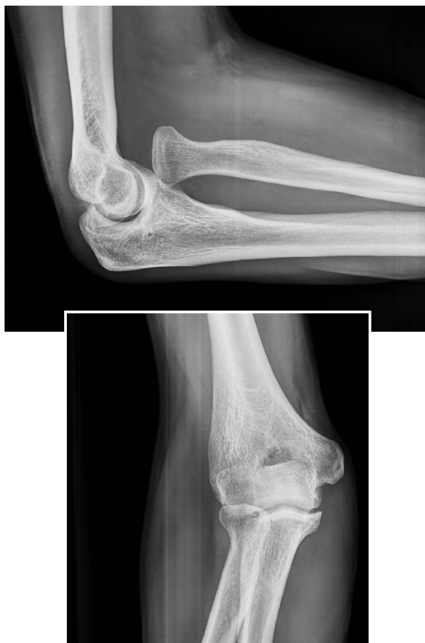
Figura 1. Imagen de radiografía simple de codo en lateral y anteroposterior, donde se observa la luxación anterior aislada de la cabeza de radio.

Paciente varón de 32 años, sin antecedentes médicos ni quirúrgicos de interés que acudió al Servicio de Urgencias de Traumatología tras accidente casual presentando traumatismo directo sobre miembro superior derecho a nivel del codo, provocado por caída desde su propia altura, golpeándose en el codo derecho en flexión. A la exploración física presentaba una leve tumefacción del codo con dolor a la palpación en olécranon y cara externa, sin afectación clínica neurovascular distal. La movilidad del codo presentaba una extensión completa, flexión limitada 30° y pronosupinación discretamente limitada.