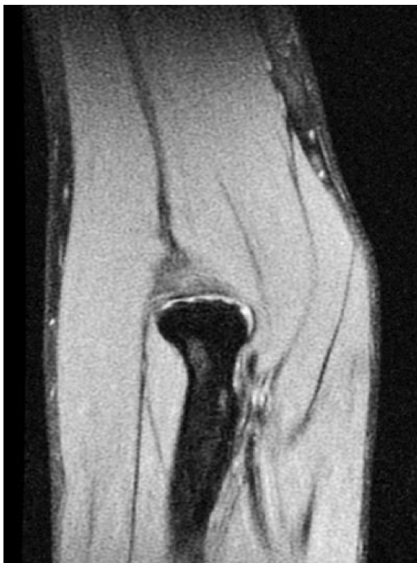
Figura 4. Imagen de RNM (STIR supresión grasa) corte coronal, donde se observa mínimo edema de partes blandas.

En la radiografía antero-posterior y perfil de codo derecho (Fig. 1), se observó una luxación anterior aislada de la cabeza radial sin trazos de fractura añadidos. Se interrogó nuevamente al paciente que negó el haber teni-