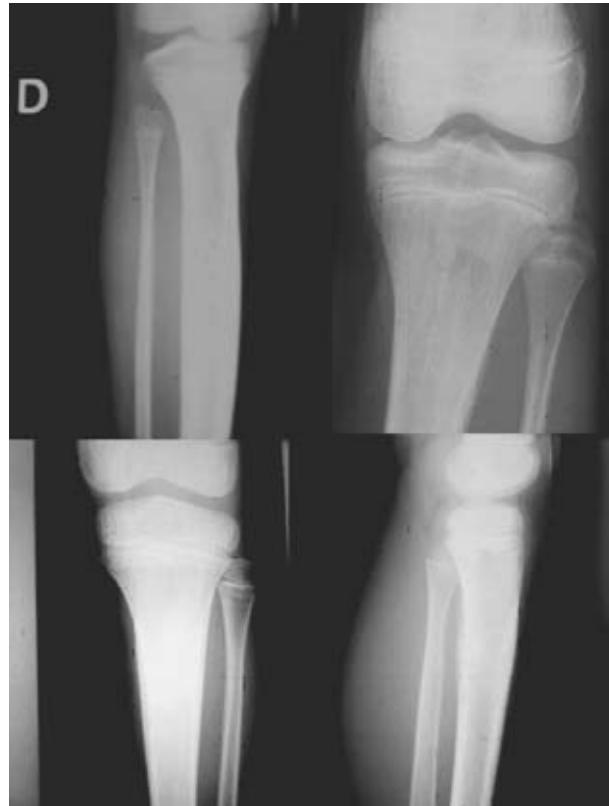
Figura 2. Estudio radiográfico de las fracturas a nivel de la tibia. Tres casos en metafisis proximal y uno en diáfisis.

estudiaron 9 pacientes, 5 niños y 4 niñas, con una edad media de 10,11 años (rango: 5-14). El tiempo de diagnóstico medio fue 17,6 días (rango: 1-92).