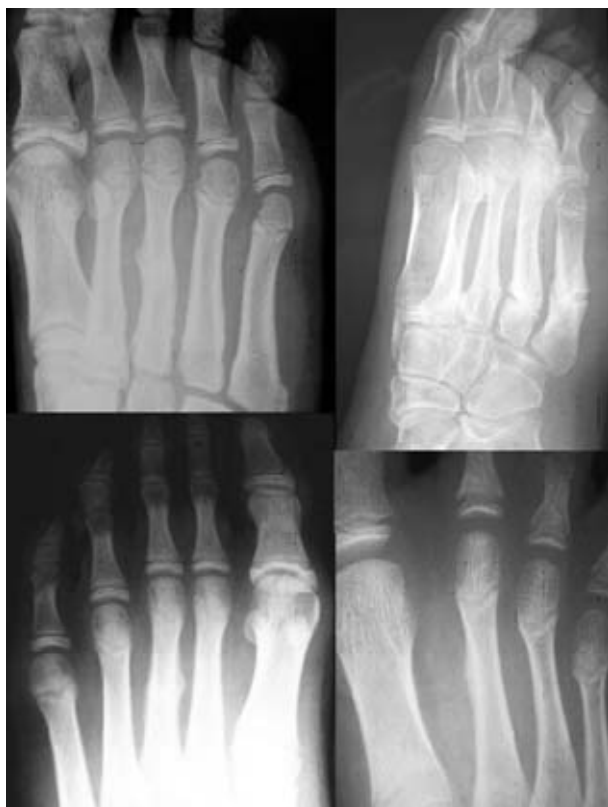
Figura 3. Estudio radiológico de fracturas de metatarsianos. Dos en tercer metatarsiano, una en segundo metatarsiano y otra con fracturas en 3º, 4º y 5º.

ingreso hospitalario. El estudio gammagráfico con tecnecio demostró una intensa captación diafisaria tibial, y la resonancia magnética describía una afectación medular diafisaria con reacción perióstica en capas de cebolla. La gammagrafía con Galio y la analítica descartaron una posible osteomielitis, con estos hallazgos se orienta un diagnóstico inicial de sarcoma de Ewing, iniciándose su estadiaje mediante TAC toraco-abdominal que fue negativo. La biopsia con trocar informó de sarcoma, pero se realizó una segunda biopsia percutánea con la que se llegó al diagnóstico definitivo de Fractura de Estrés diafisaria de tibia.