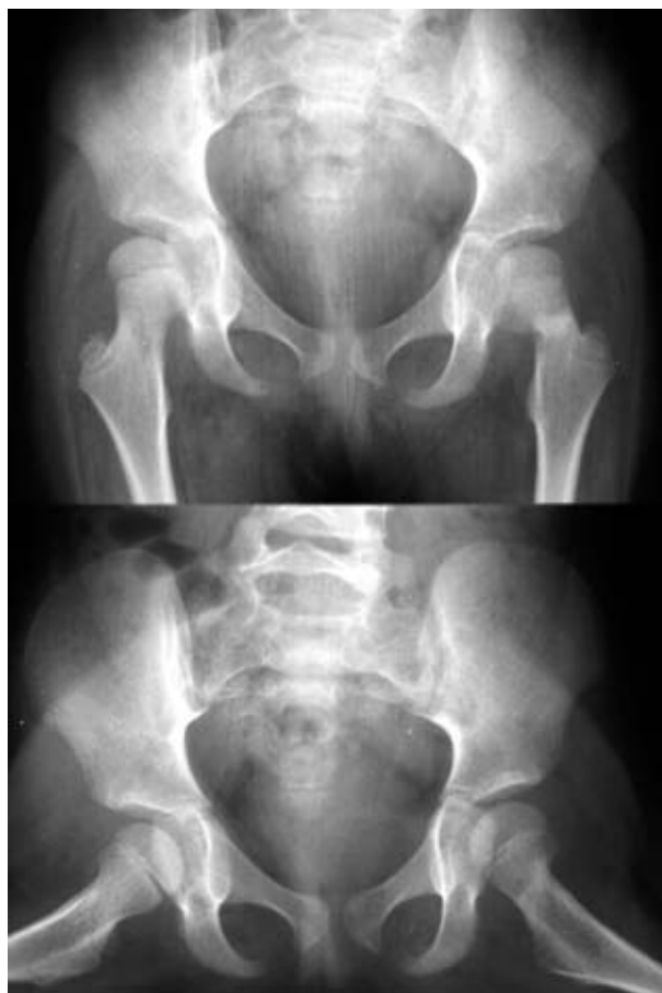
Figura 4. Estudio radiológico de fractura de cuello femoral en paciente con síndrome de Down.

Las fracturas por estrés o fatiga se producen cuando el hueso está sometido a cargas repetidas en una fre-