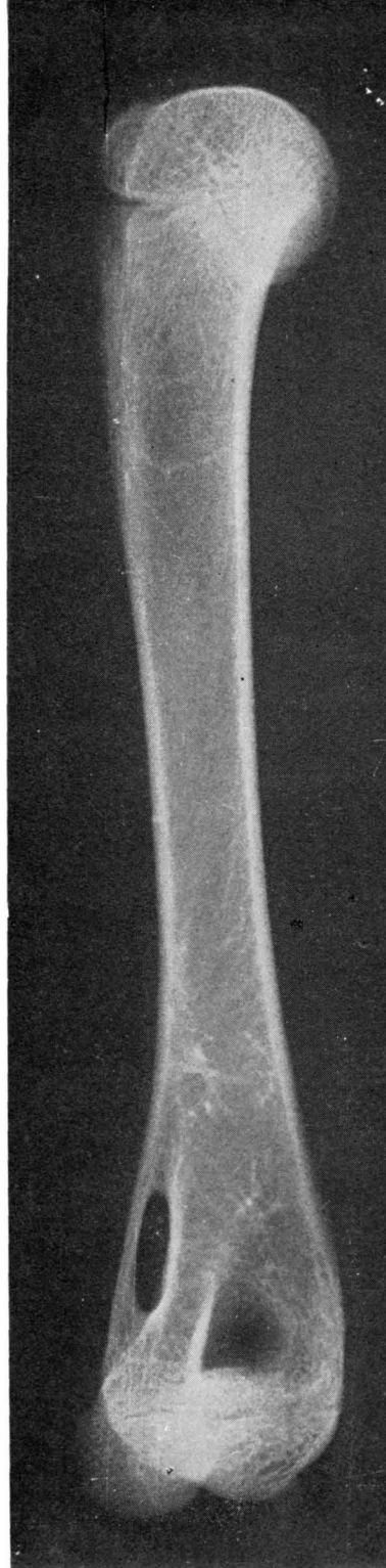
FIG. 3. — Radiografía A/P de húmero de gato, en el que se evidencia el foramen supraepitrocLEAR .

MITTAL y GUPTA, 1978 (12) al comentar su caso de compresión simultánea del nervio cubital y nervio mediano, encuentran que el ligamento de Struthers, una vez que procedente de la apófisis supraepitrocLEAR alcanza la epitroclea se continúa hacia abajo y lateralmente con una banda tensa