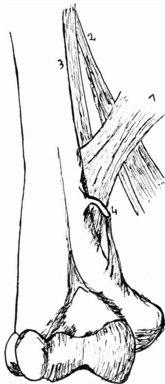
GRÁFICA 2. — 1. Arcada de Struthers. 2. Ligamento braquial interno. 3. Tabique intermuscular interno. 4. Apófisis supraepitrocLEAR.

La compresión del nervio mediano es mucho más frecuente que la compresión del nervio cubital, debido fundamentalmente a que el nervio cubital rara vez