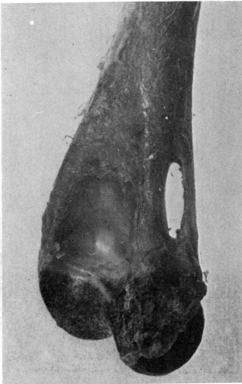
FIG. 2. — Pieza anatómica de húmero de gato en visión posterior. Foramen supraepitrocLEAR.

Con el nombre de apófisis supraepitrocLEAR —proceso supracondíleo interno del