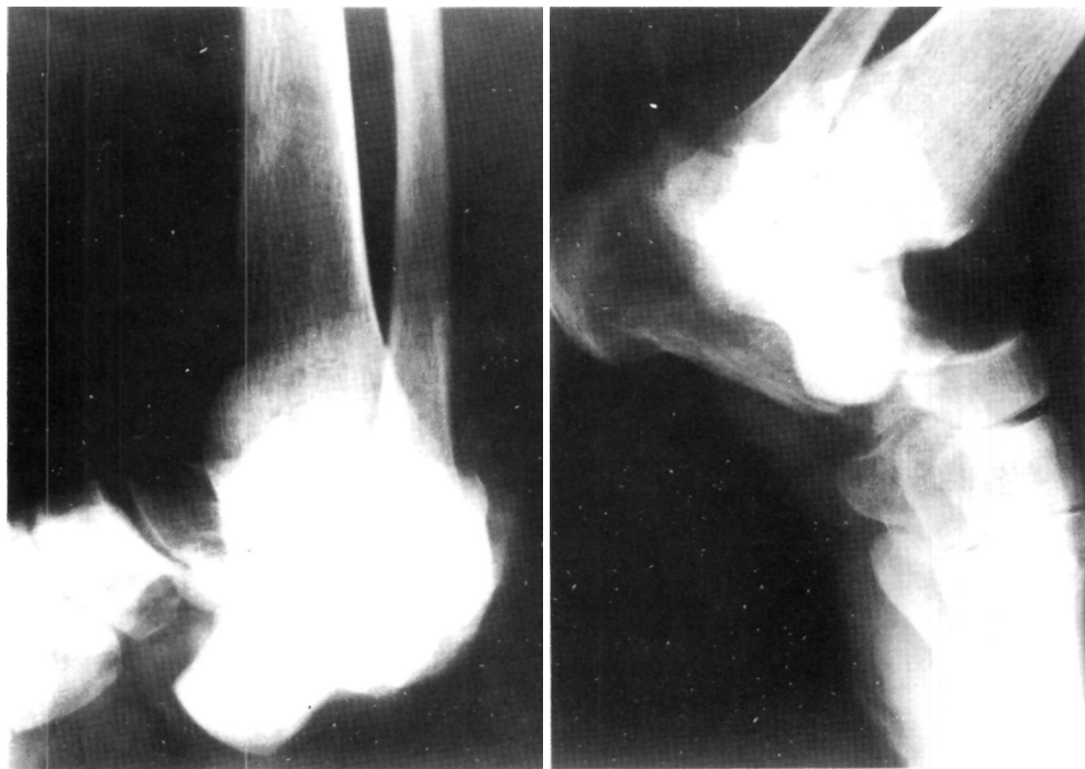
FIGS. 3 Y 4.—Proyecciones laterales de tobillo donde se aprecia la enucleación del astrágalo en la vertiente medial del tobillo.