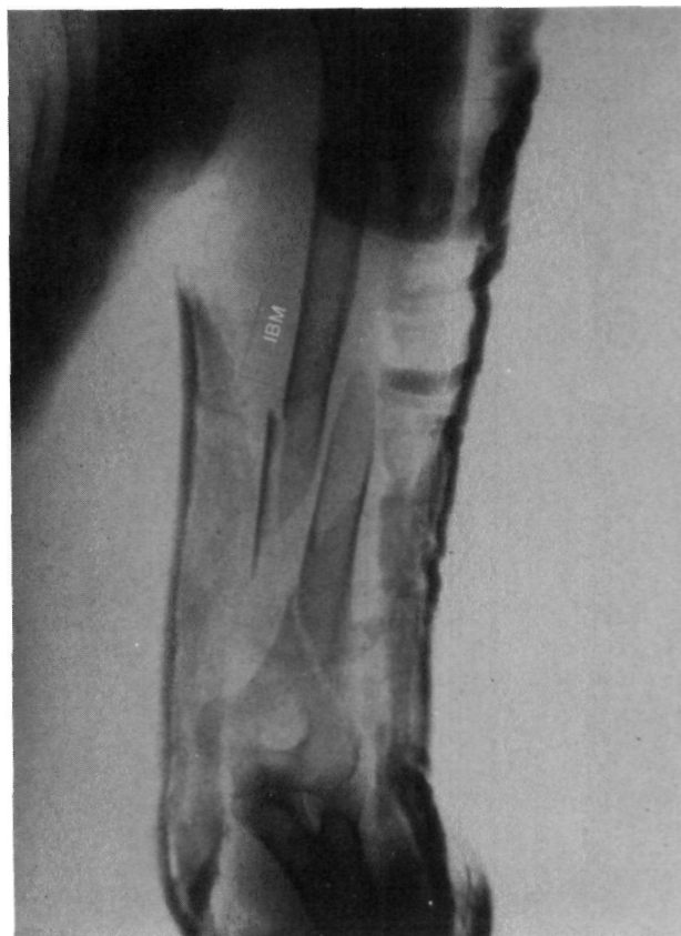
Figura nº 1. Caso 8. Imagen radiológica de una fractura compleja del extremo distal del húmero tras intento de reducción ortopédica.

Dos de los 6 pacientes fueron inmovilizados durante un mes mediante un brazal de yeso adicio-