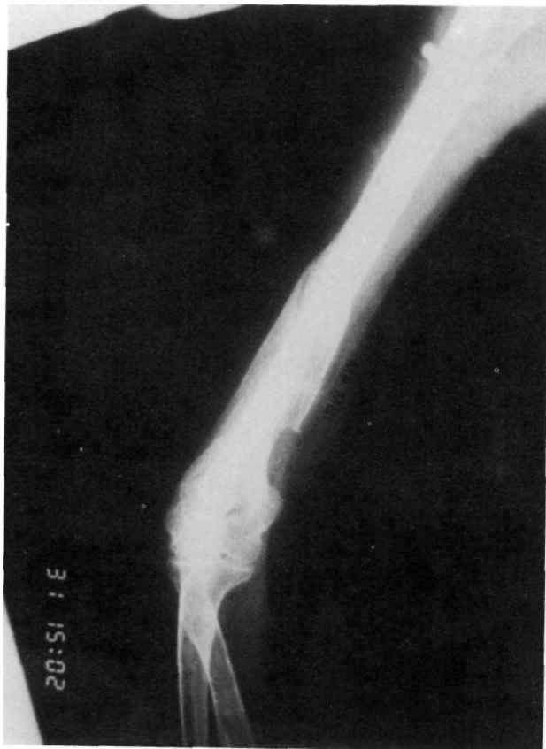
Figura n° 3. Control radiológico con imagen de consolidación 4 meses después.

nal. Una mujer (caso 2) presentaba una osteoporosis que hacía dudar al cirujano la estabilidad de la osteosíntesis. El segundo (Figuras n° 1,2 y 3), se trataba de una fractura del tercio distal con extensión supracondílea (caso 8).