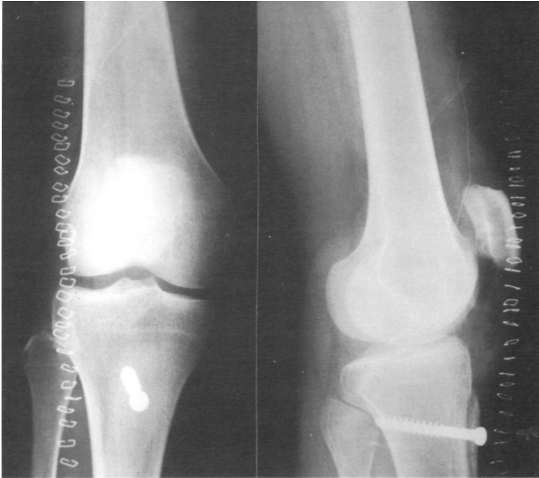
Figura 2. Radiografías AP y L postoperatorias, tras realineación proximal y distal.

Los resultados del estudio radiológico, siguiendo los criterios de Aglietti y col. (6, 9) fueron: El índice T-R (Insall-Salvati) fue normal en 6 casos y mayor de 1,23 (rótula alta) en 20 casos. El ángulo del surco fue patológico (mayor de 140^\circ ) en todos los casos. El ángulo de congruencia de Merchant (10) fue patológico también en todos los pacientes (mayor de 9^\circ ) (tabla III).