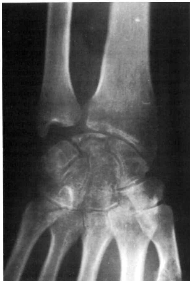
Figura 1. Osteoporosis del carpo. Colapso del semilunar. Lesiones osteolíticas en estiloides radial y carpo, y pinzamiento radio-carpiano.

semilunar, imágenes líticas en la estiloides radial y huesos del carpo y una osteoporosis generalizada de muñeca (Fig. 1). No existe cubitus minus. El único dato a destacar de la analítica es un ácido úrico de 7,9 mg/100 ml.