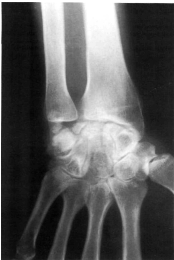
Figura 3. Radiografía de la muñeca. 12 años de evolución. Colapso parcial del semilunar, pseudoartrosis del polo súper-cubital y pinzamiento radio-carpiano.